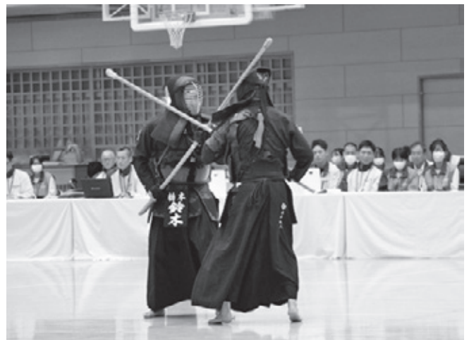
銃剣道競技 成年男子 第7位 栃木県選抜