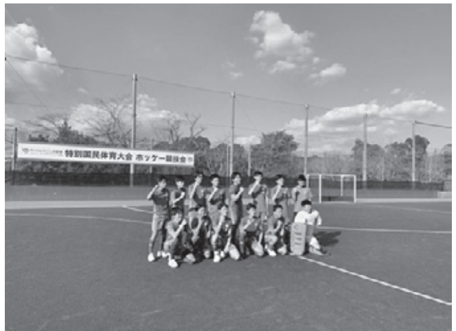
ホッケー競技 少年男子 優勝 栃木県選抜