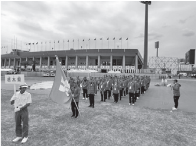
総合開会式・現地激励会 栃木県選手団