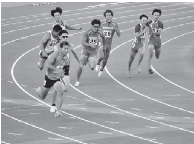
陸上競技 男子 成年少年男子共通 4x100mR 第4位 栃木県選抜