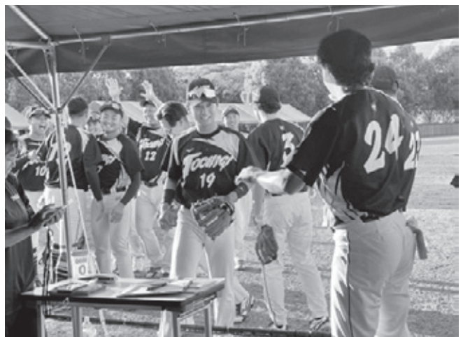
ソフトボール競技 成年男子 優勝 栃木県選抜