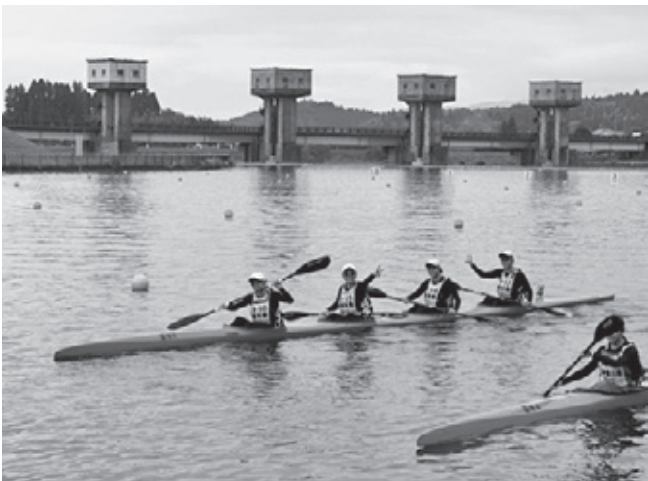
カヌー競技 少年女子 スプリント K-4 (500m) 第5位 栃木県選抜