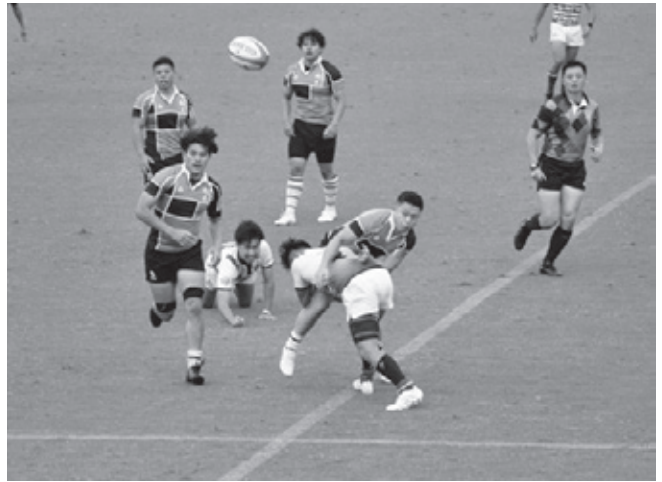
ラグビーフットボール競技 成年男子 第7位 栃木県選抜