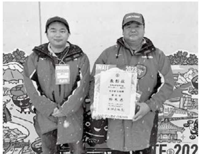
スキー競技会女子総合成績 第6位