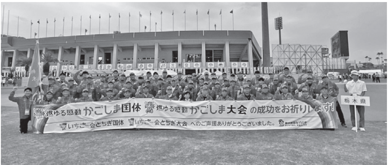
総合成績 天皇杯16位 皇后杯19位