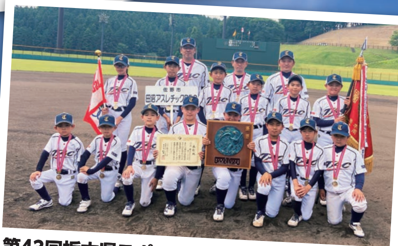
第43回栃木県スポーツ少年団軟式野球交流大会 優勝 田沼アスレチックBBCスポーツ少年団