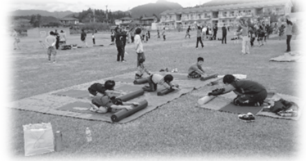
(令和元年度のSCフェスタの様子)

地区ごとに交流イベント（SCフェスタ）を開催し、体験教室や交流大会を実施しクラブの紹介なども行っています。