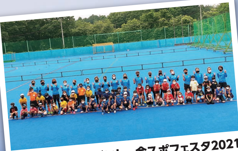
県民の日協賛イベント 今スポフェスタ2021 小学生ホッケーセミナー